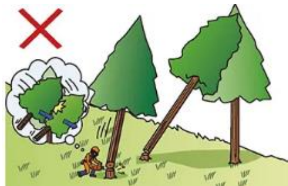
(2) 投げ倒し（浴びせ倒し）