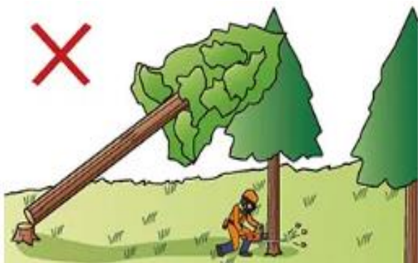
(1) かかられている木の伐倒