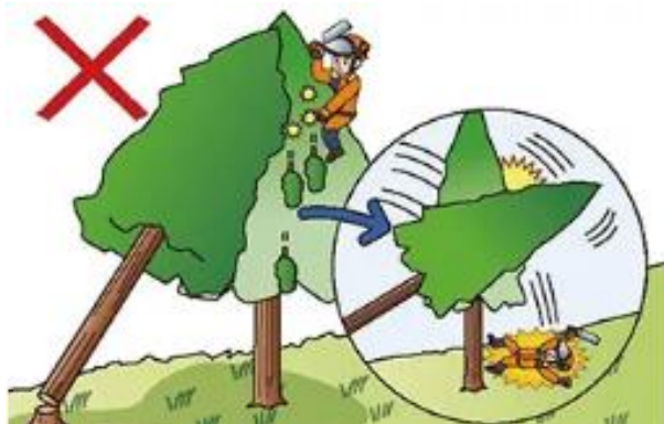
(4) かかられている木の枝切り